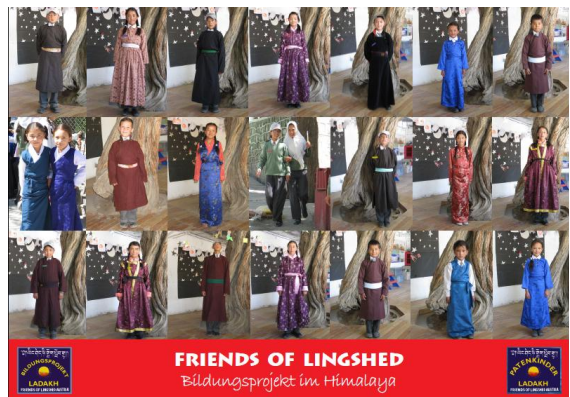
Vorderseite der A5-Karte

Die diesjährige Weihnachtsausendung beinhaltet eine wunderschön gestaltete A5-Karte (Grundlage ist das Plakat, das für unsere Ausstellung „Ladakh mit Kinderaugen“ im April 2011 verwendet wurde) und eine Zusammenstellung der Patenkinderfotos von Evas und Irmis Ladakhbesuch 2009.